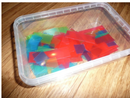
LANGUETTES EN PLASTIQUE TRANSPARENT (BLEU, VERT, ROUGE)