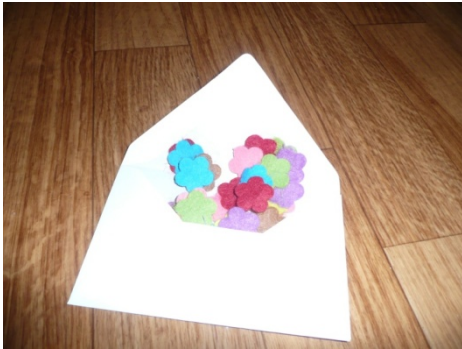
FLEURS EN FEUTRINE