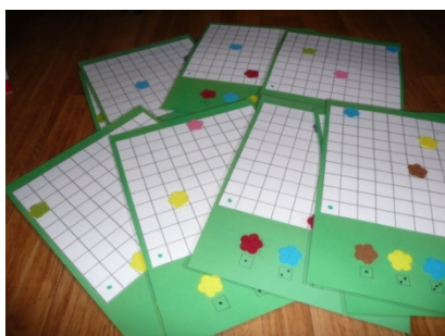
PLATEAUX DE JEU