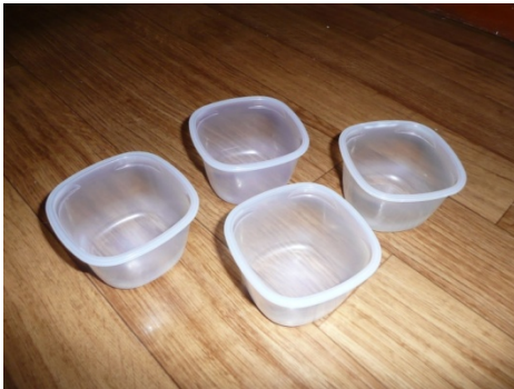
4 POTS EN PLASTIQUES