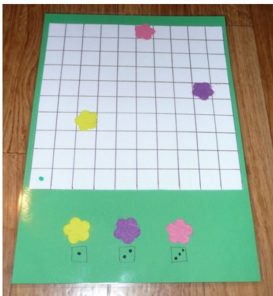
EXEMPLE D'UN PLATEAU DE JEU